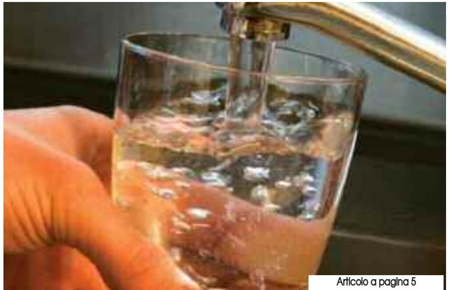
Articolo a pagina 5